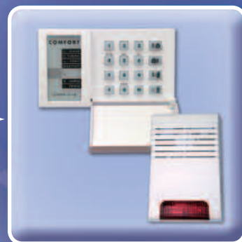
Informace z bezpečnostního systému