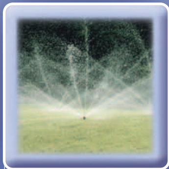
Časové spínání: závlaha, osvětlení apod.