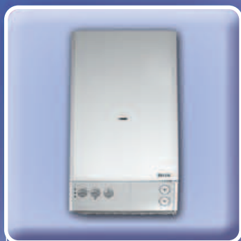
Regulace teploty: topení, klimatizace apod.