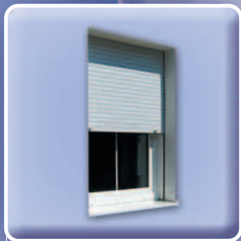
Ovládání spotřebičů: bezpečnostní rolety, bezpečnostní systém apod.