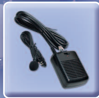
Hlasová komunikace a odposlech prostoru