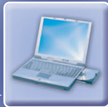
Přenos dat do PC, poruchová hlášení